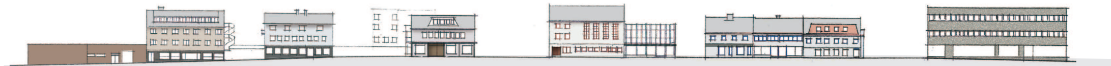
EKSISTERENDE FORHOLD: Eksisterende fasader og fargert, Dr. Wesselsgate nord, nr. 3-19

NB: fargepalett ..... justeres på endelig tegning