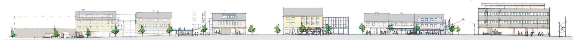
FRAMTIDIG GATE: Forslag til fargepalett og framtidige utvidelser Dr. Wesselsgate nord, nr. 3-19