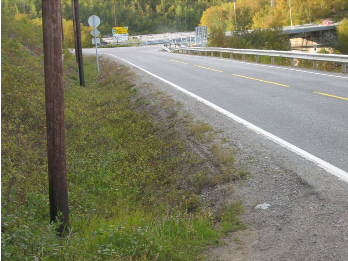
Bildet viser siktforholdene fra adkomstveien mot Neiden bru.

Fartsgrensen er 60 km/h gjennom området der avkjørselen er lokalisert. I og med at siktforholdene er minimum 100 meter til begge sider, vurderes siktforholdene som akseptable.