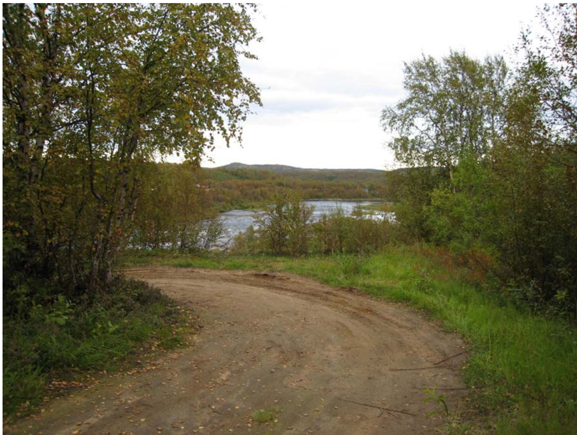
Bildet viser adkomstveg der den svinger ned mot E6. Bakkekant i bakgrunnen. Skoltebyen ligger i området bildet er tatt, men bakkekant og vegetasjon medfører at denne ikke kan ses.

Den østlige/sørøstlige delen av planområdet er lokalisert i området rundt bakkekanten ned mot E6. I dette området er det igjen mer frodig, og også her er middels stor bjørkeskog er dominerende skogtype.