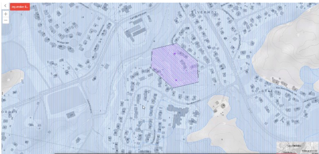
Figur 2: Registrert kvikkleireområde.

Tiltaket ble gjort for å gi sikring for boligfeltene som grenser mot bekkene på vestsiden av FV 8810.