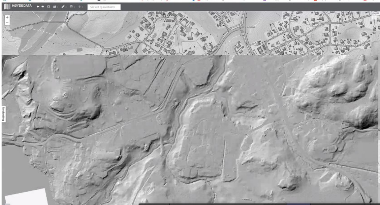
Figur 4: Høydeforskjeller. 3D med høydedata kan brukes som hjelp til å finne områder som det bør fokuseres særlig på i det videre arbeidet.