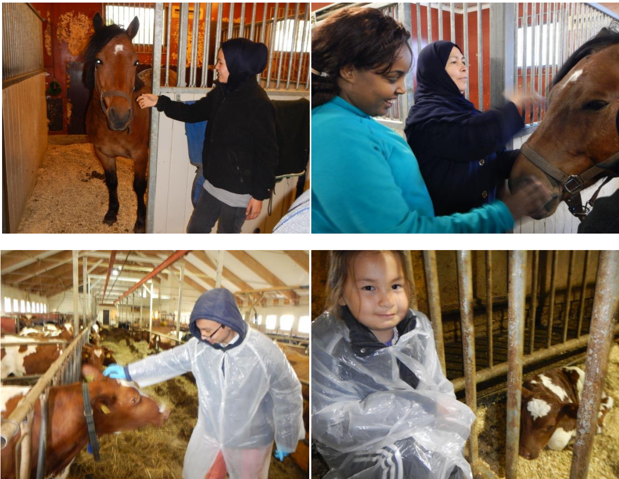
Gårdsbesøk med hester og kyr.

Kurset på Bioforsk Svanhovd besto av moduler og omhandlet blant annet natur- og friluftsliv, geografi og lokalhistorie, grenseforholdet til Finland og Russland, klima, miljø, plante- og dyreliv. Deltakerne fikk omvisning i botanisk hage og på bjørneutstillingen. I tillegg var det omvisning på flere av gårdsbrukene i Pasvik, og som avslutning var det en dagstur i Øvre-Pasvik med orientering, bærplukking, fugletitting og søk etter bjørnespor. Et gjennomgående tema var om hvordan lokalbefolkningen kan leve tett på bjørn.