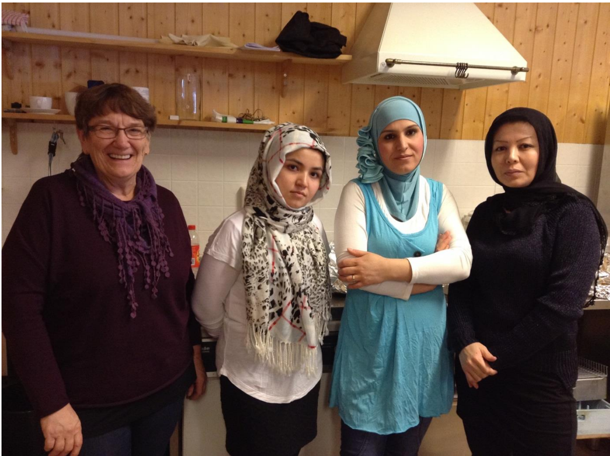
Fra lørdagskafe på Pasviktunet