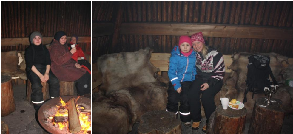
Bålkos ved Birk Husky.

På høsten var det Røde Kors sine topp-turer til Øretoppen og Bugøynesfjellet. I tillegg er det arrangert små og store turer i nærområdet i Pasvikdalen. Blant annet fisketurer, bærplukking, hundekjøring, bålkos mv.