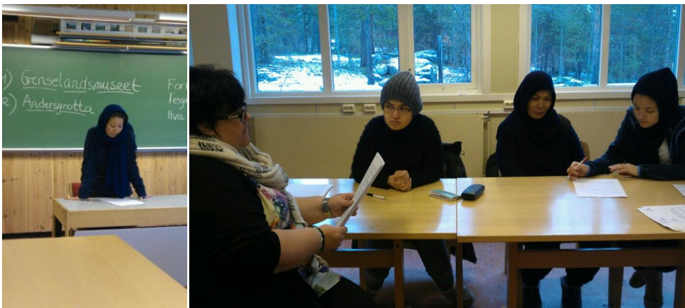
Temauker på Pasvik Folkehøgskole.

På høsten var det temauker om grunnlovsjubileet, og frigjøringsjubileet i anledning 70 års markeringen i Øst-Finnmark. Det var omvisning på Grenselandsmuseet, Andersgrotta, krigsmonumentene, og bibliotekets jubileumsutstilling. Kransenedleggelse på Svanvik og omvisning på den nye grensestasjonen var også en del av opplegget. Deltakelse i introduksjonsdeltakernes sangkor som ble etablert i anledning Kongebesøket, der de sang ved Kongens lunch på Grenselandmuseet i oktober. Workshop med tema om grunnlovsjubileet, frihet, menneskerettigheter, FN og barnekonvensjonen. Deltakerne lagde tegninger, skrev stiler, og lagde plakater, og holdt rørende presentasjoner for hverandre, om tema som de selv er så berørt av.