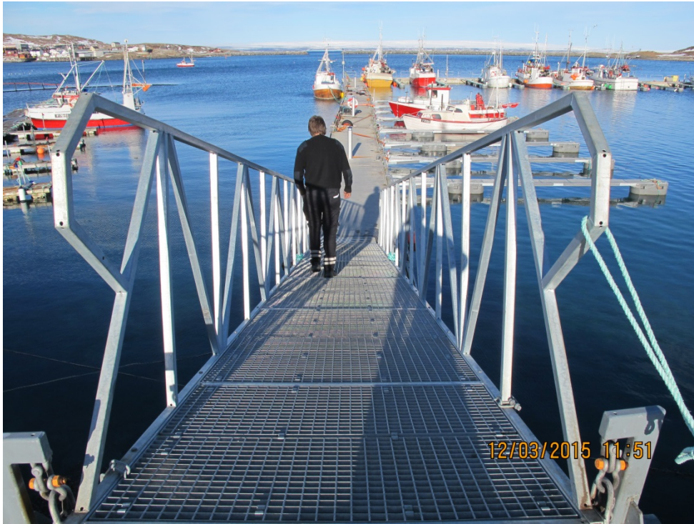
Bilde: Flytebryggeanlegget i Bugøynes