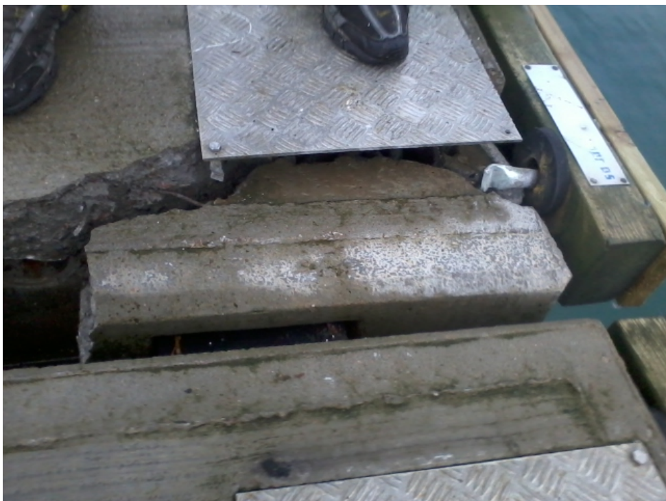
Bilde: Store skader på hjørner

Flytebryggenes hjørner på flere tilkoblingspunkter er blitt knust. Havneadministrasjonen har hatt store utfordringer gjennom hele vinteren med å sikre slik at det ikke havarerte fullstendig. Det vil ikke være forsvarlig å ha anlegget en høst- og vintersesong til slik det er nå. Ut i fra en helhetsvurdering anser havneadministrasjonen det som uunngåelig enn å anskaffe nye erstatningsflytebrygger.