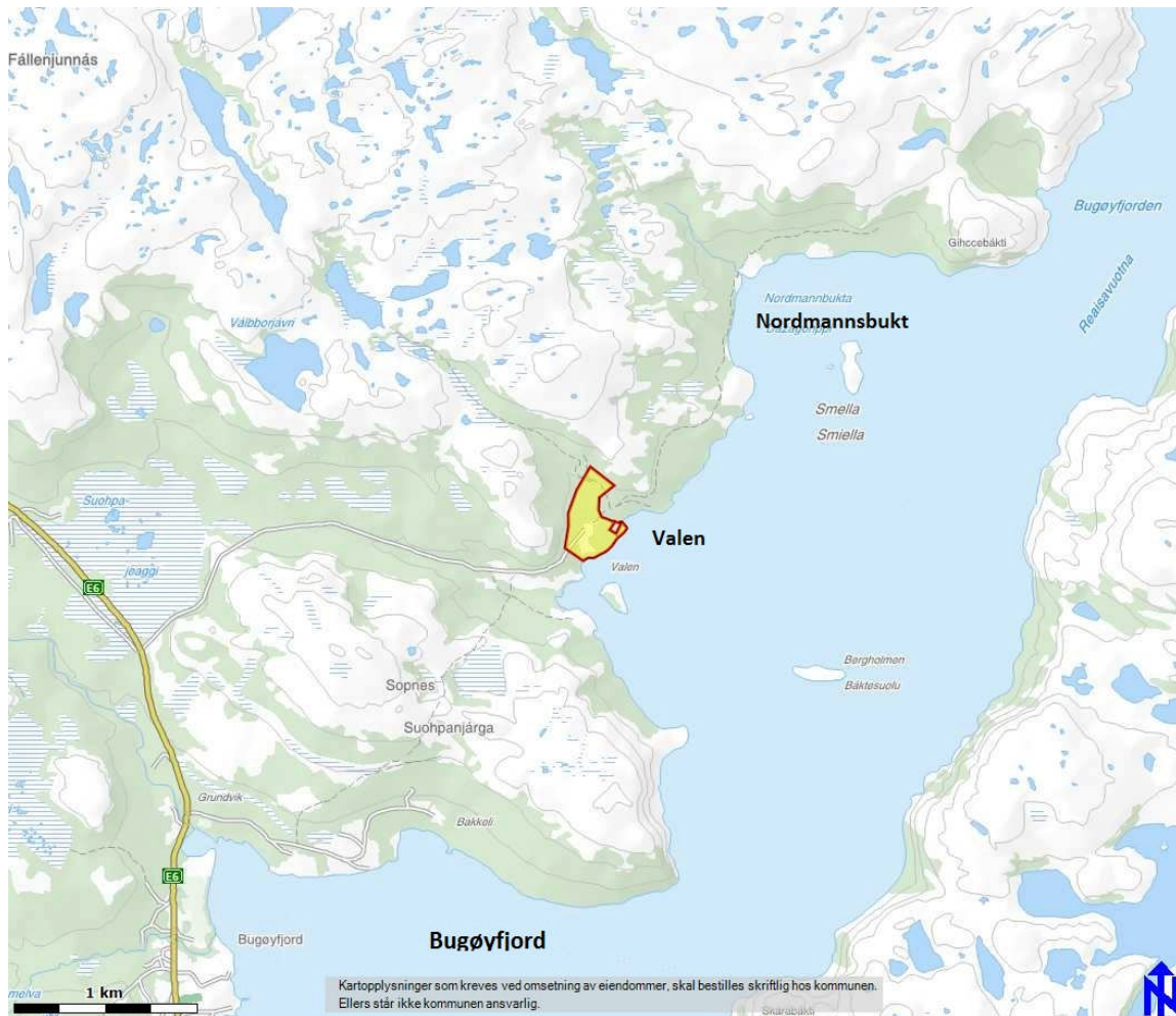
Fig. 1. Oversiktskart